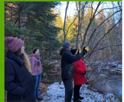
VÉLO CHARLEVOIX Début du chantier au Domaine des Cimes