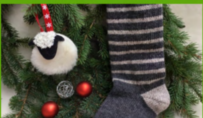
LES PETITS PILOUS Activité de financement de Charlevoix Pure Laine