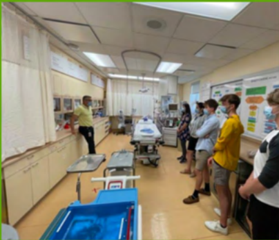
LIVING LAB DE CHARLEVOIX Poursuite de la collaboration avec l'équipe