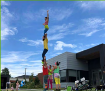
LE FESTIF! DE BAIE-SAINT-PAUL Prestation artistique dans les milieux de vie